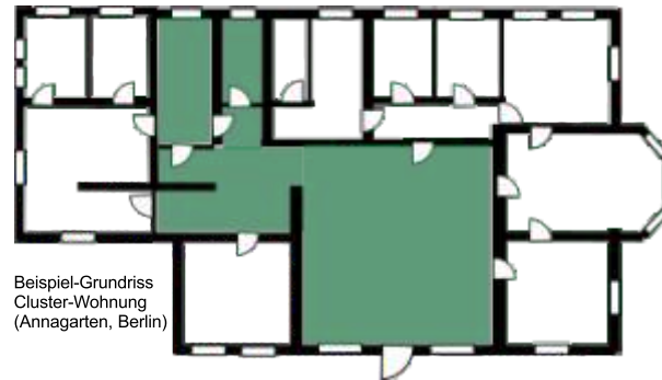
Beispiel-Grundriss Cluster-Wohnung (Annagarten, Berlin)

Innovative Cluster-Wohnungen verbinden mehrere Privatbereiche - jeweils mit WC, Dusche und Teeküche - mit gemeinsam genutzter Wohnküche und Aufenthaltsräumen.